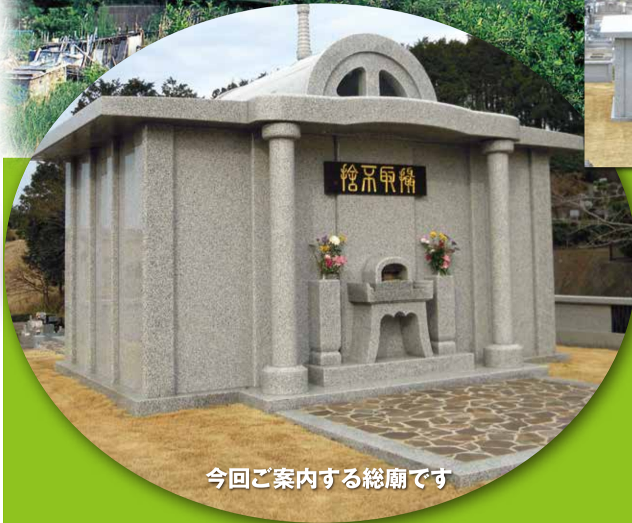
今回ご案内する総廟です