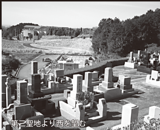
第二聖地より西を望む